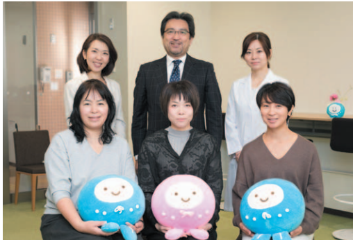
座談会にご協力、ご参加いただいたみなさん。