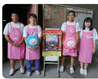
宿毛高校生がボランティアで お手伝いしてくれました

夏休みということからご応募が多く、参加は抽選になりました。参加していただくことができなかった皆さま、本当に申し訳ありません。12月にはクリスマスコンサートを開催します。詳しくは同封のチラシをご確認ください。多くの方のご参加をお待ちしています。