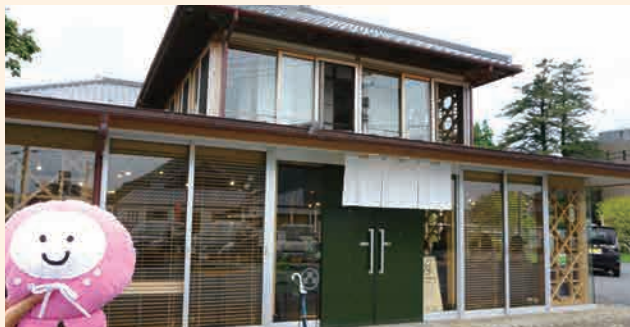
地域の素材にこだわったランチやサンドイッチ、スイーツなどが食べられます!

昨年4月に築128年の建物の大規模改修が行われ、「観光交流拠点=宿毛まちのえき」として生まれ変わった「林邸」をご紹介します。今年4月には、併設の「林邸カフェ」もリニューアルオープンしました。お子さま連れでもゆっくりでき、観光客や市民の交流の場として人気のスポットになっています。林邸のすべての部屋は一部屋1時間300円から借りることができ、レンタルスペースとしてイベントや教室に利用されています。館内は無料で見学できるので、宿毛へおでかけの際はぜひ立ち寄ってみてくださいね。おしゃれなカフェもオススメです!