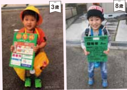
ちかうくん 高知県高知市 アルバムを見返して候補を探していたら、ちょうど回覧板が来たのでこれにしました。